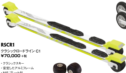
RSCR1 クラシックロードライン C1 ¥70,000 + 税

SWIX ローラースキーは北欧の歴史あるブランド「プロスキー」によって企画・製造されトップアスリートに愛用されています。