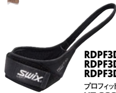
RDPF3DS = S サイズ RDPF3DM = M サイズ RDPF3DL = L サイズ プロフィット 3D ストラップ ¥7,000 + 税