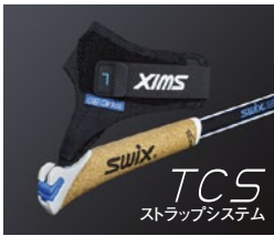
TCS ストラップシステム