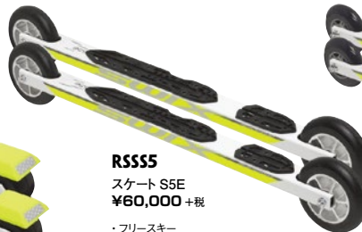
RSS55 スケート S5E ¥60,000 + 税