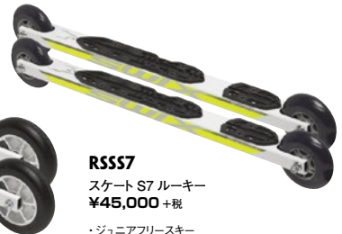
RSS57 スケート S7 ルーキー ¥45,000 + 税